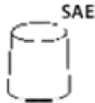
Right - Positive