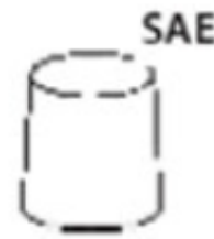
Right - Positive